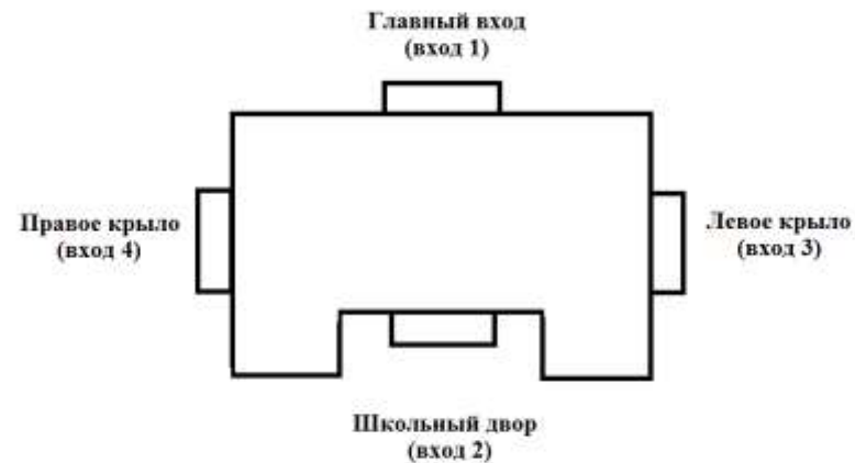
Схема расположения входов / выходов в школу: